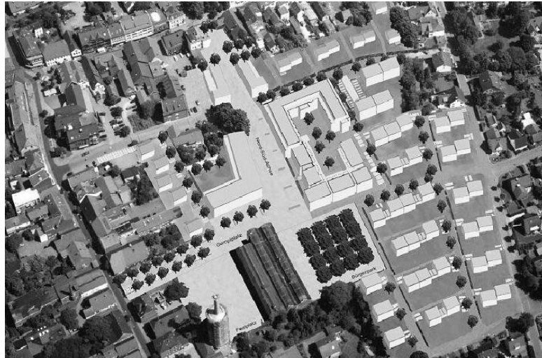
Ideenumsetzung nach städtebaulichem Wettbewerb

Diese Vorgaben und Anregungen flossen in einen Städtebaulichen Ideenwettbewerb Gempt für das gesamte Gelände und in einen Architektenwettbewerb hinsichtlich der Gempt-Halle ein, die wiederum Voraussetzung für eine Förderung des Landes Nordrhein-Westfalen waren.